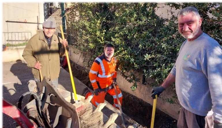
Aménagement de l'implantation de la tonnelle