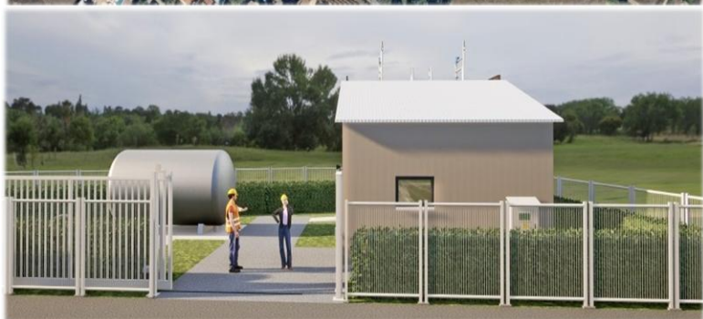
Plan de situation et esquisse de la future unité de traitement.