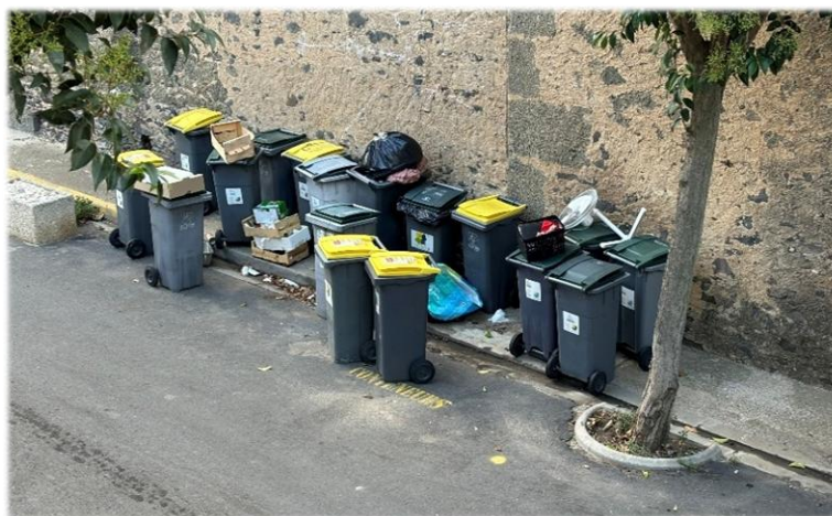
Dépôt anarchique sur un point de collecte

Un retour à des solutions collectives réduisant le nombre des bacs pourrait être envisagé dans le centre du village.