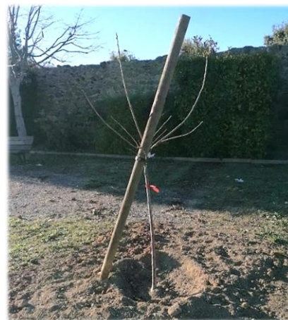
Cerisier, rue des mimosas

Toutes ces années l'effort a porté sur le rafraîchissement en plantant dans le village des arbres de hautes tiges et de grande envergure. L'équipe municipale a choisi cette saison, sans savoir que ce serait la dernière, de rajouter dans son patrimoine arboré, des essences fruitières. Arbousiers, abricotiers, amandiers, cerisiers, figuiers ont ainsi été distribués sur le territoire.