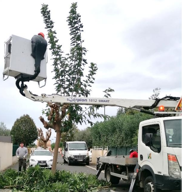
Taille des mûriers avec la nacelle

L'entretien des espaces verts et des linéaires d'arbres ou de haies occupe une place importante dans les travaux à accomplir par les agents des services techniques.