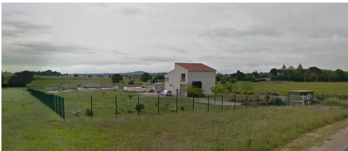
Station d'épuration du S.I.V.U Montblanc – Valros

Les flux hydrauliques journaliers sont en moyenne à 46% par rapport au nominal. La station est dimensionnée pour la partie hydraulique et sera en capacité de raccorder les nouveaux habitants sur Valros.