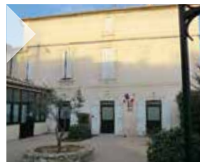
◆ LA MÉDIATHÈQUE DE VALROS