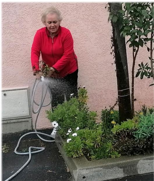
Un grand merci à une voisine attentionnée